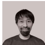
ふみやコーチ (JBA公認B級コーチ)