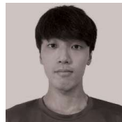
あゆみコーチ (高校インターハイ出場)