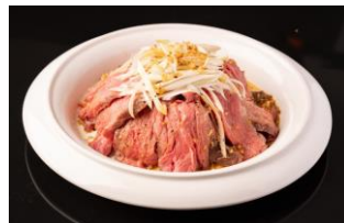
ネギ塩ダレスステーキ丼