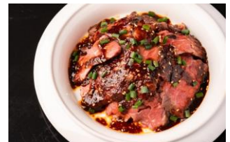
ユッケダレスステーキ丼