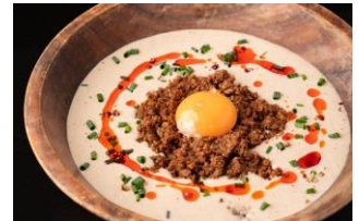
冷やしタンタン麺