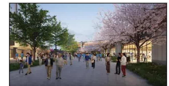
(新) 陸上競技場・野球場周辺