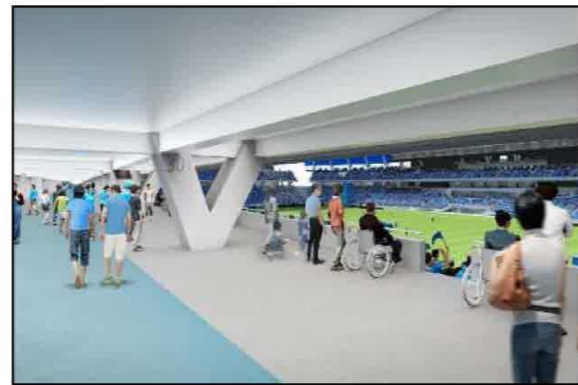
フィールドとつながるメインコンコース