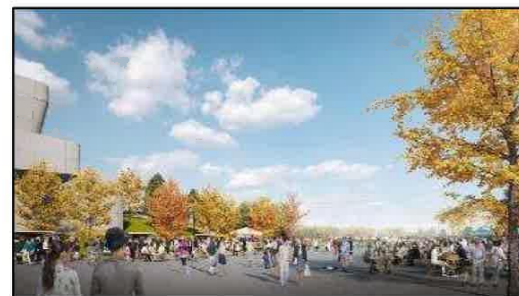
アリーナ前の広場「プラザ」