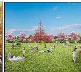
芝生広場・大型遊具