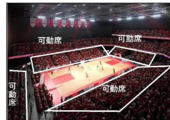
スポーツ利用時の観客席のイメージ

スポーツ興行とコンサート、展示会利用等を両立するU字形状のアリーナ (可変的な観客席計画)