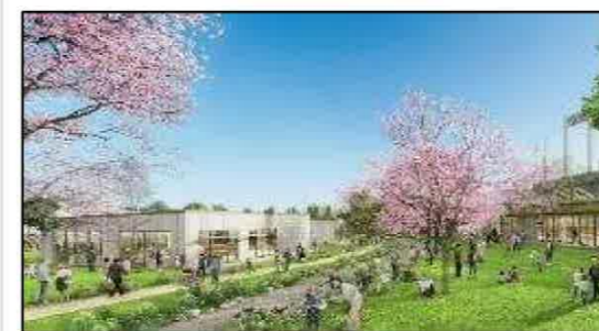
草地広場付近（野球場北側）