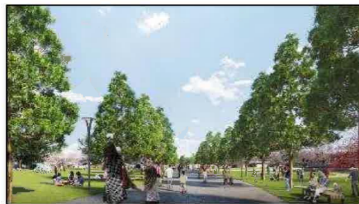
主要動線「アクティビティループ」