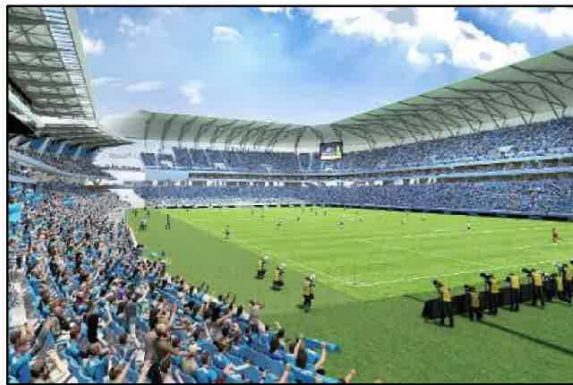
フィールド目線が体感できるゼロタッチ席